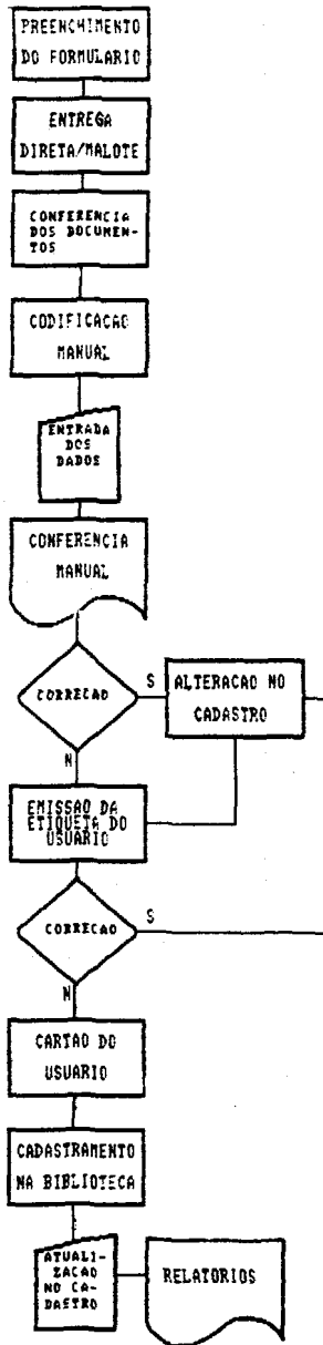
FIGURA 2 – PROCESSO DE CADASTRAMENTO DE USUÁRIOS DO SISTEMA DE BIBLIOTECAS DA UFPR