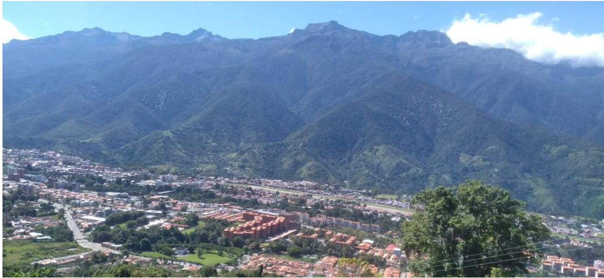
Figura 2 – Panorámica de la ciudad de Mérida, con la Sierra Nevada de fondo