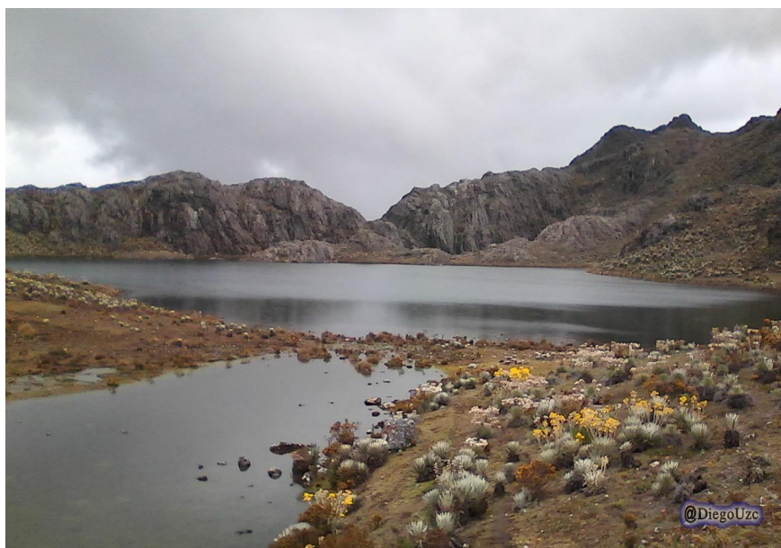
Figura 4 – Laguna La Pata

Así se convierte en un tema de suma importancia, en especial porque constituye la esencia de los lugares, se manifiesta en sus paisajes y la totalidad de los elementos que los caracterizan, en la manera de relacionarse su gente, los lugareños. Instituye la esencia de la identidad, local, regional o nacional. Involucra la apropiación del legado por parte de un grupo determinado y su riqueza consiste en que pasa a ser un elemento para construir unión y consenso. El patrimonio tiene la capacidad de impulsar sentimientos de afirmación y pertenencia, puede afianzar o estimular la conciencia de identidad de los pueblos en su territorio que permite resguardar acciones culturales propicias a la integración.