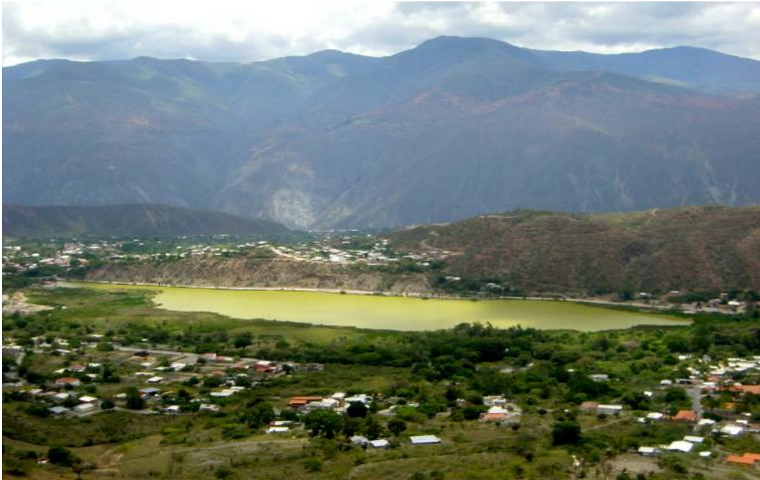
Figura 3 – Laguna de Urao