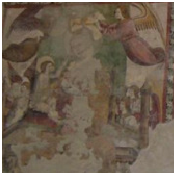
(Igreja S. Maria dei Greci – Agrigento, Itália)

Celebrada pelos anjos, Maria representa a celebração da vida e da nutrição do menino Deus na Terra. E, assim como Atena, representa a batalha racional e inteligente contra as intempéries da natureza. No entanto, enquanto Atena representa a conciliação do humano com as intempéries da natureza, a nutrição de Maria representa o litígio do humano com a não-realidade externa ao templo. Seu leite é símbolo da preparação do menino Deus para enfrentar os males da vida física, que seria um tipo de não-realidade por estar distanciada das verdades metafísicas. O sofrimento seguido de uma morte dura e cruel é seu sacrifício. Sacrifício enfrentado pela força que o nutriu. Maria, sua mãe, é, nesse sentido, símbolo da nutrição da alma, uma vez que nutre o menino Deus para cumprir seu desígnio.