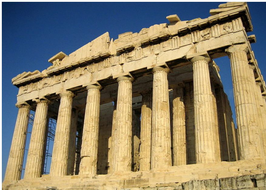
(Parthenon, acrópole de Atenas, Grécia)

O projeto é dos arquitetos Calícrates e Ictinos. As esculturas e a supervisão do escultor Fídias. Entre 447a.C. e 433a.C., tanto o projeto arquitetônico quanto as esculturas estavam prontas. Péricles, mais que promover a reconstrução do antigo templo, iniciou uma obra que seria um marco histórico para uma ideia de democracia duradoura. E Atena era a deusa que melhor representava esta simbologia, já que Atenas era uma cidade que buscava guerrear não pela brutalidade, mas pela inteligência. Isto, é claro, sem idealizar a polis .