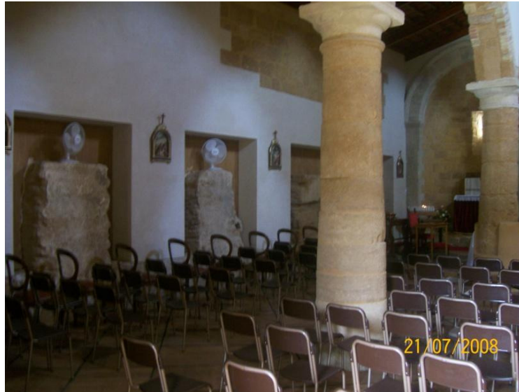
(Igreja S. Maria dei Greci – Agrigento, Itália)

A começar pelo nome da Igreja, é notória a confluência cultural entre simbologia pagã e simbologia cristã: Maria, mãe de Deus, assume um templo de Atena, deusa dos gregos, e torna-se agora, ela própria, grega. Dito de outra forma: mãe dos gregos também.