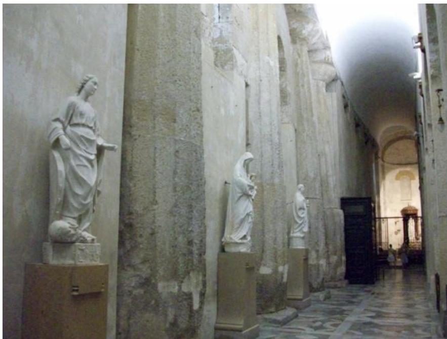
(Catedral de Siracusa – Siracusa, Itália)

Executada no século V a.C., o templo dedicado a Atena foi construído na parte mais elevada da ilha de Ortigia. Sua estrutura dórica foi adaptada à natividade de Maria no século VI d.C.. 20 A adaptação do peristilo, em um tipo de cela, causaria ao espaço a garantia de uma realidade que se pretende separar-se da não-realidade 21 do espaço externo. E Maria e a nutrição do menino Deus passariam a ser o modelo verossímil de realidade.