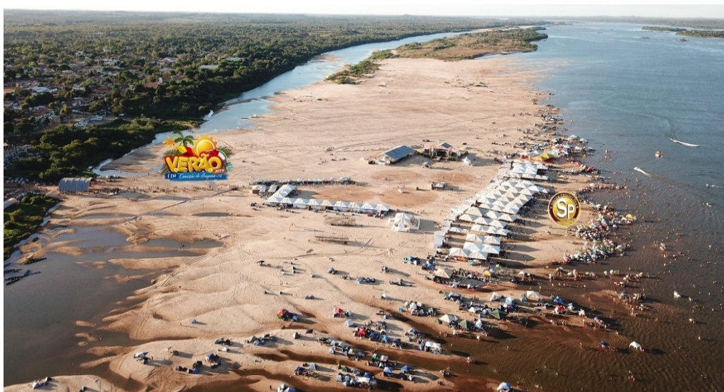
Figura 2: A praia das Gaivotas em 2019.