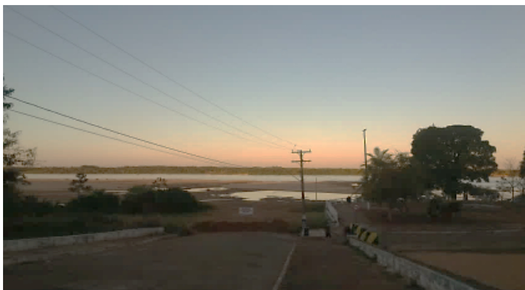
Figura 3: Primeiro Domingo de Julho (época do veraneio em outros anos) em Plena Pandemia.